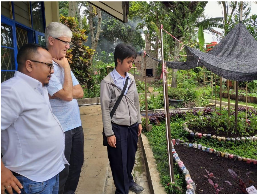
Buitenlandse belangstelling voor de ecologische moestuintjes van de adoptiekinderen en hun ouders