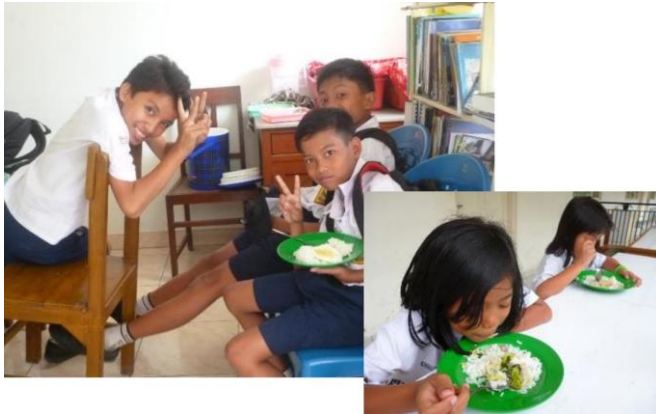
Adoptiekinderen die thuis onvoldoende te eten krijgen, genieten in de schoolpauze van een gratis warme maaltijd

Ons belangrijkste project is het adoptieproject dat kansarme Indonesische kinderen de mogelijkheid biedt basisonderwijs en middelbaar onderwijs te volgen. Dankzij het adoptieproject hebben inmiddels honderden kansarme kinderen met succes hun middelbare school afgerond en werk gevonden. Per 31-12-2018 waren er 41 kinderen via onze stichting financieel geadopteerd door 38 adoptieouders uit Nederland. Door de zusters Dominicanessen in Cimahi wordt voor elk van deze kinderen een individuele administratie bijgehouden van inkomsten en uitgaven, waaronder schoolgeld, het verplichte schooluniform, de schoolboeken, schriften enz. Ook krijgen de adoptiekinderen in het eigen polikliniekje van de zusters gratis tandheelkundige en eenvoudige medische hulp. Voor adoptiekinderen die thuis onvoldoende te eten krijgen, wordt in de schoolpauze een gratis