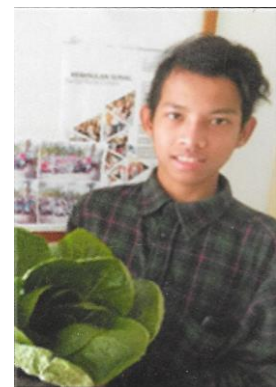
Adoptiekind met zelf gekweekte groente