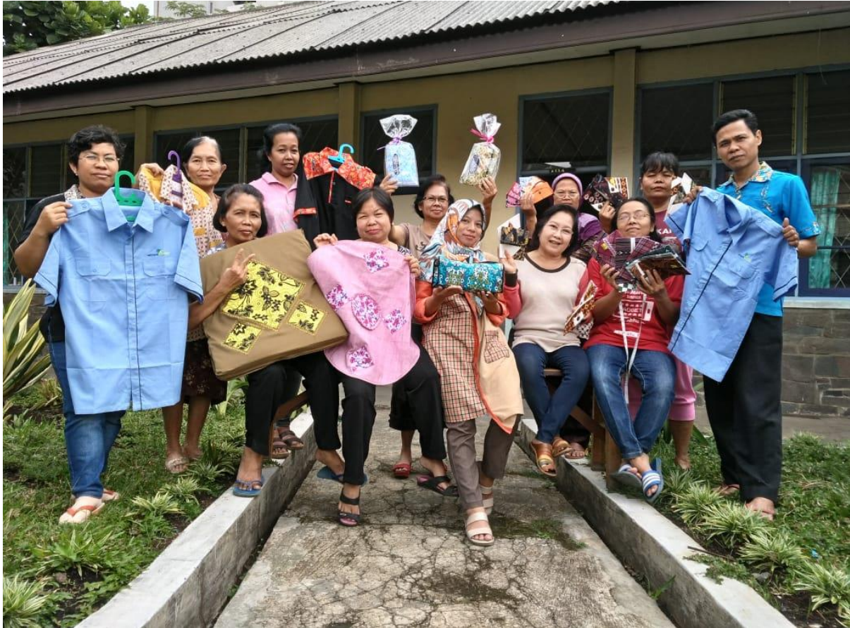
Medewerkers van het naaiatelier laten zien wat zij zoal gemaakt hebben