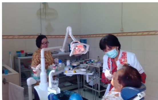
Een van de behandelkamers in de polikliniek