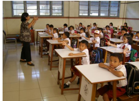
Een van de scholen van de zusters waar ook de adoptiekinderen les krijgen

warme maaltijd gekookt. In 2018 heeft één adoptieouder opgezegd, maar dankzij een bijzondere wervingsactie van een bestaande adoptieouder in Hoofddorp konden twee nieuwe kinderen worden geadopteerd. Omdat het richtbedrag van € 25 per maand per kind een drempel kan zijn, is hij in zijn familie- en kennissenkring op zoek gegaan naar mensen die € 5 per maand willen bijdragen. Met succes: in het verslagjaar zijn op deze wijze tien donateurs geworven die per vijf samen een kind adopteren. Inmiddels (maart 2019) is een derde groep van vijf gevormd. Een prachtig initiatief, waar wij blij mee zijn. Ook voor andere mensen die een kansarm kind willen helpen, maar € 25 per maand te veel vinden, is een gezamenlijke adoptie met één of meer anderen wellicht een optie.