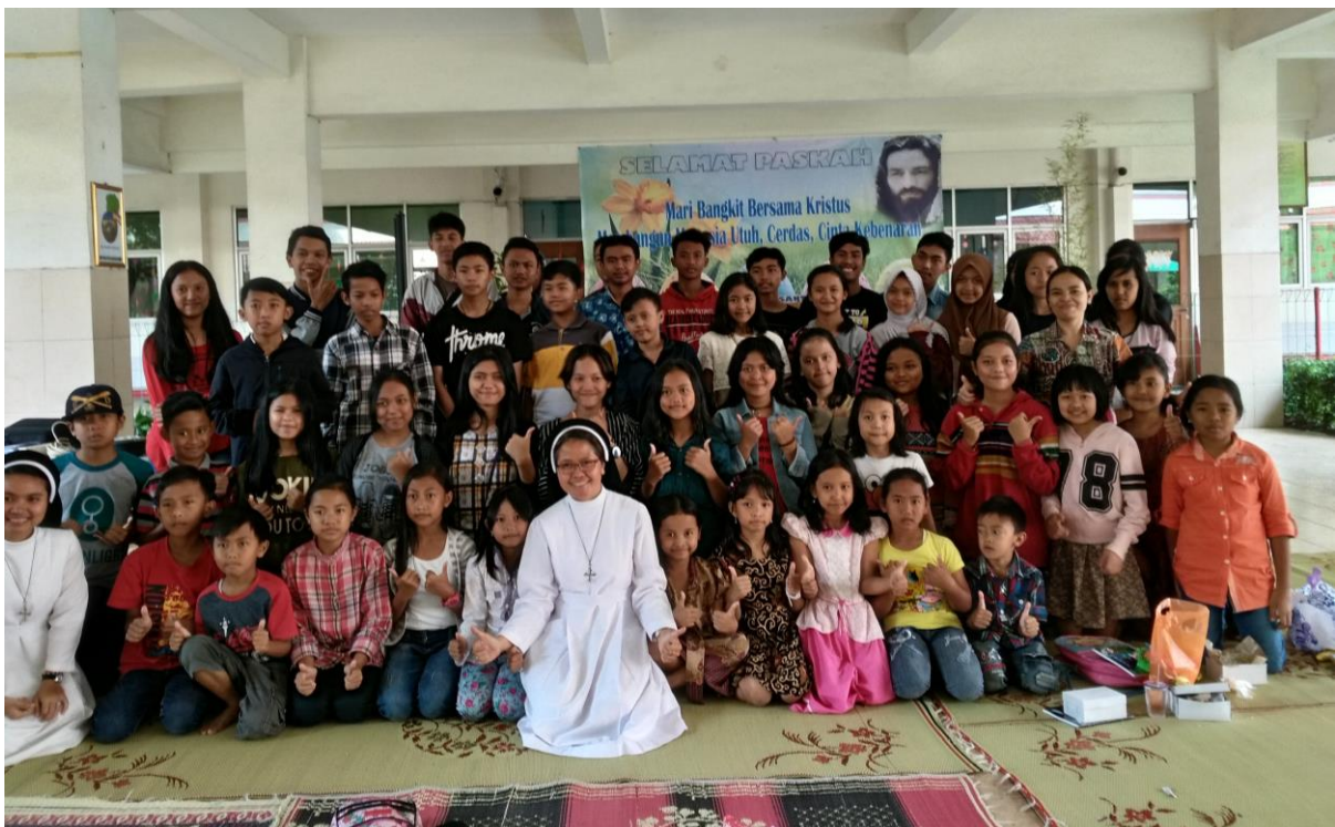
Door het adoptieteam georganiseerde bijeenkomst voor de adoptiekinderen

warme maaltijd gekookt. In 2018 heeft één adoptieouder opgezegd, maar dankzij een bijzondere wervingsactie van een bestaande adoptieouder in Hoofddorp konden twee nieuwe kinderen worden geadopteerd. Omdat het richtbedrag van € 25 per maand per kind een drempel kan zijn, is hij in zijn familie- en kennissenkring op zoek gegaan naar mensen die € 5 per maand willen bijdragen. Met succes: in het verslagjaar zijn op deze wijze tien donateurs geworven die per vijf samen een kind adopteren. Inmiddels (maart 2019) is een derde groep van vijf gevormd. Een prachtig initiatief, waar wij blij mee zijn. Ook voor andere mensen die een kansarm kind willen helpen, maar € 25 per maand te veel vinden, is een gezamenlijke adoptie met één of meer anderen wellicht een optie.